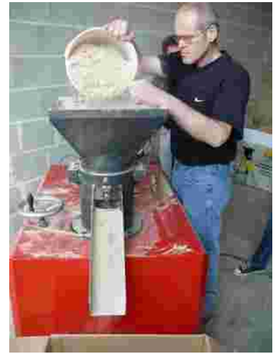
Pelletierung von Miscanthus