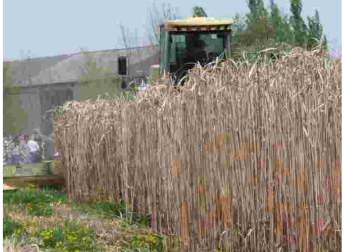
Mähen für Ballenpressung