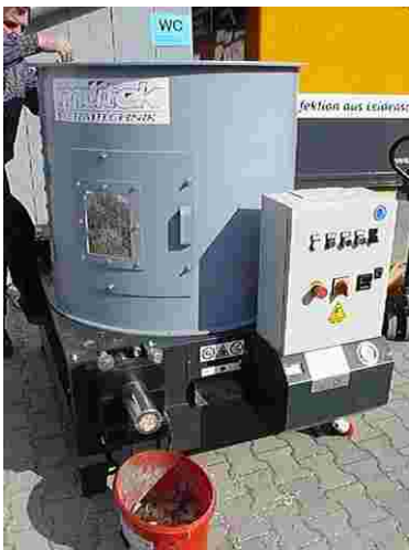
Brikettierung von Miscanthus