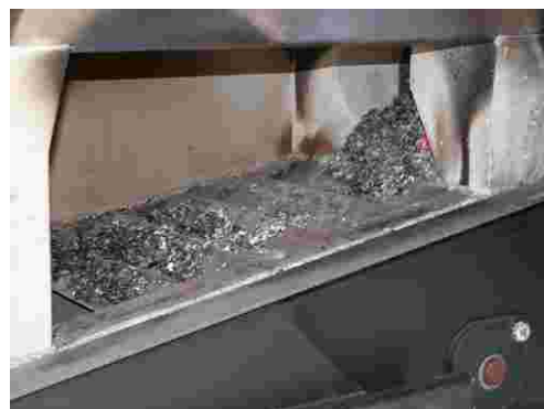
Heizungen mit Miscanthus in Betrieb.